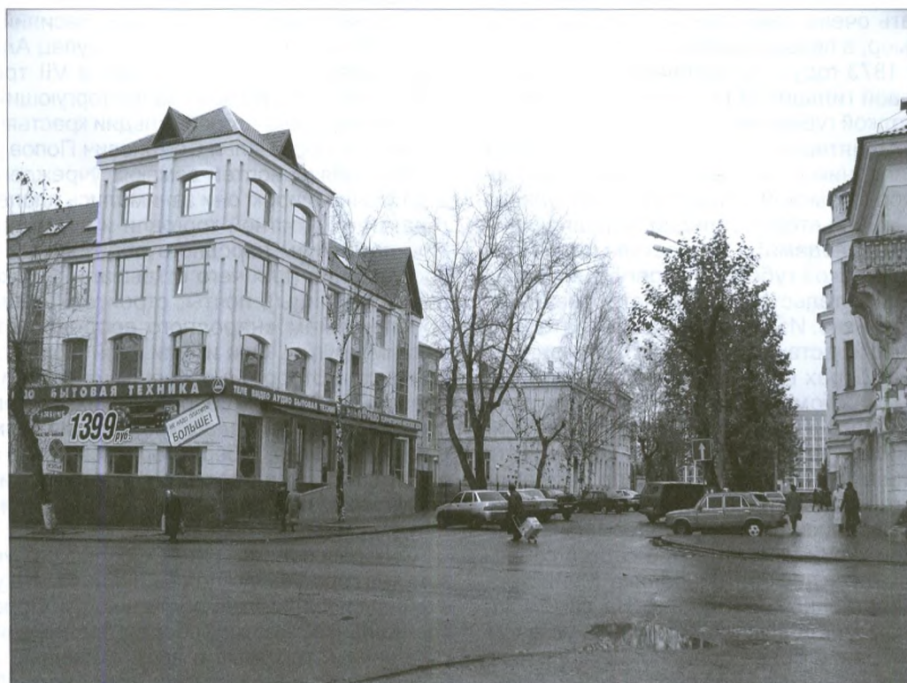
Здесь стояло здание земской управы