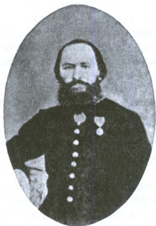
И.Н.Забоев – городской голова в 1868–1870 гг.

тировался на должность городского головы в 1891 году, когда ему было уже 77 лет.