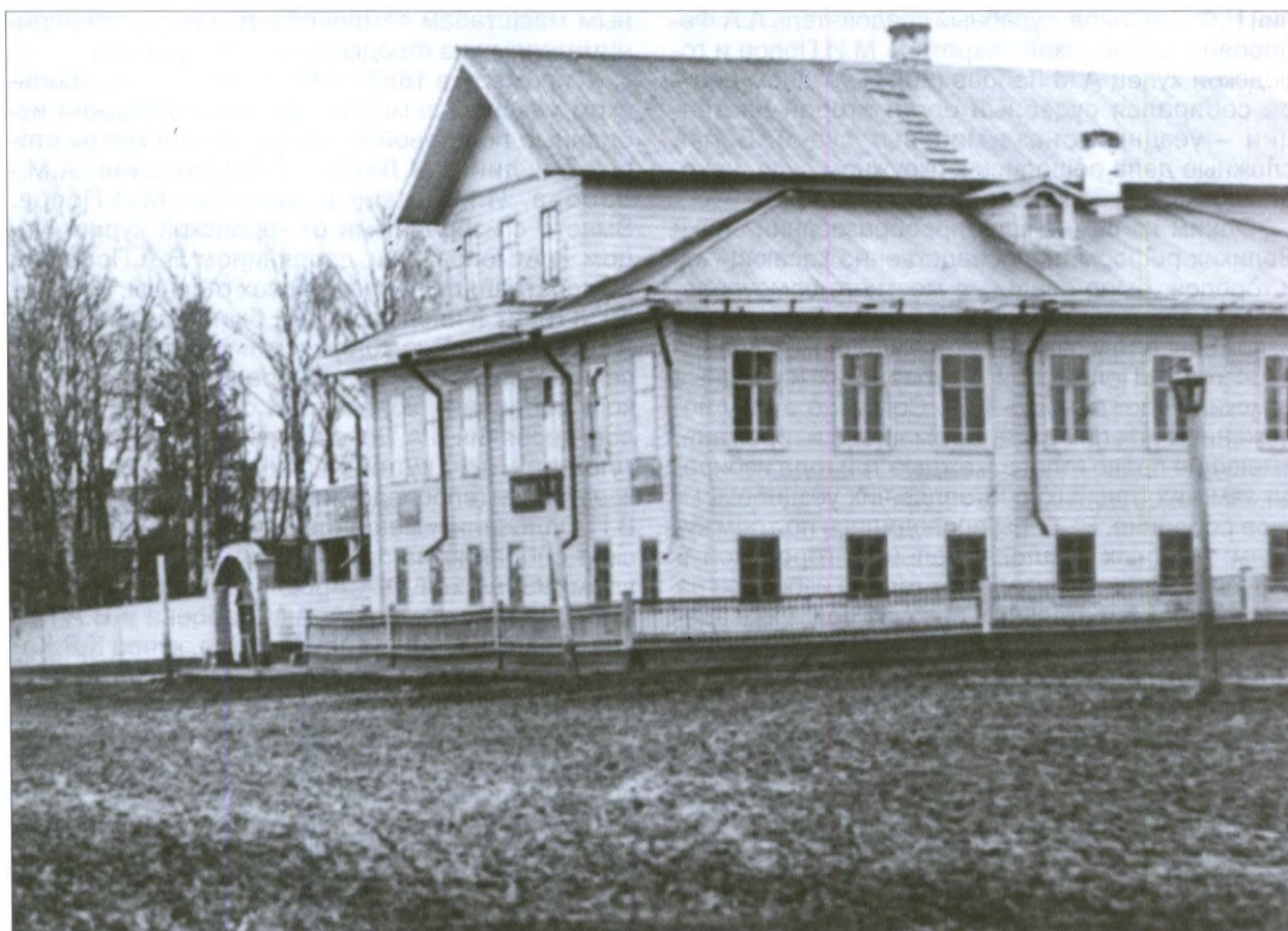
Земская управа в начале XX века, ул. Трехсвятительская и Спасская